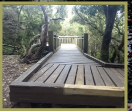
Pasarela / Cortafuegos