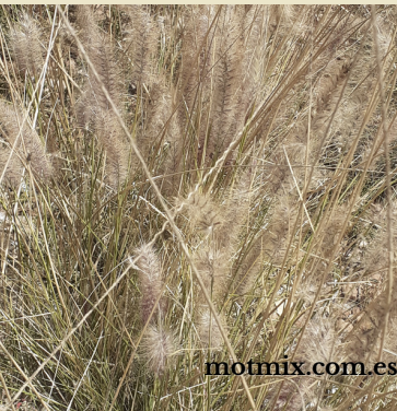
Rabo de gato